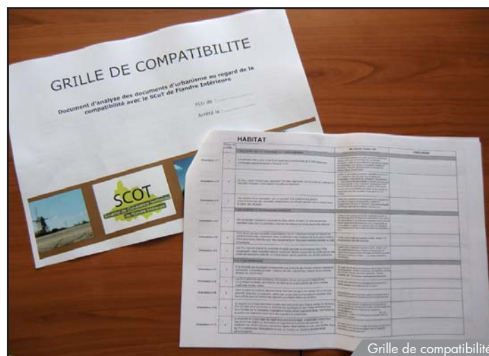
Grille de compatibilité

Prenez contact avec l'équipe technique si vous souhaitez proposer une information à l'échelle de votre communauté de communes ou de votre commune.